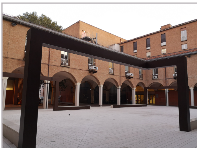
Piazza Scaravilli - Bologna