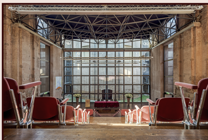
Aula absidale di Santa Lucia