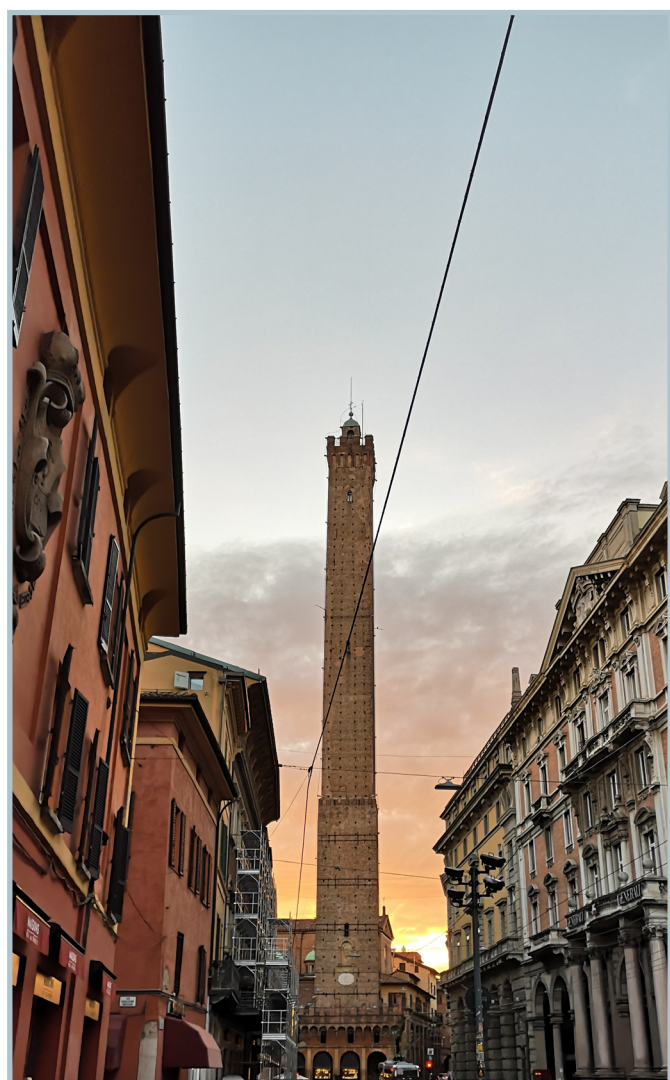
Torre degli Asinelli - Bologna